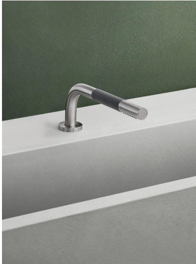
T1 Douche à main sur plan avec flexible de douche. Épaisseur du plan : max 45 mm. Percement du trou : 30 mm.