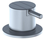
2500 Mitigeur sur plan (gros debit), levier de commande 25 mm.